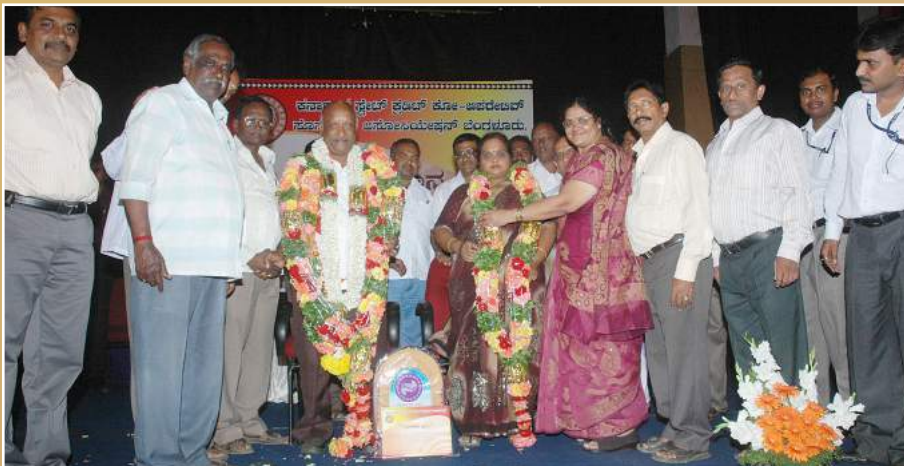
ಉತ್ತಮ ಕ್ರೆಡಿಟ್ ಸೌಹಾರ್ದಗಳೆಂದು ಶಿವಮೊಗ್ಗದ ಆರ್ಯವೈಶ್ಯ ಸಹಕಾರಿ ಸಂಘಕ್ಕೆ ಸನ್ಮಾನ : ಅಧ್ಯಕ್ಷರು ಹಾಗೂ ಆಡಳಿತ ಮಂಡಳಿಯವರಿಂದ ಪ್ರಶಸ್ತಿ ಸ್ವೀಕಾರ.