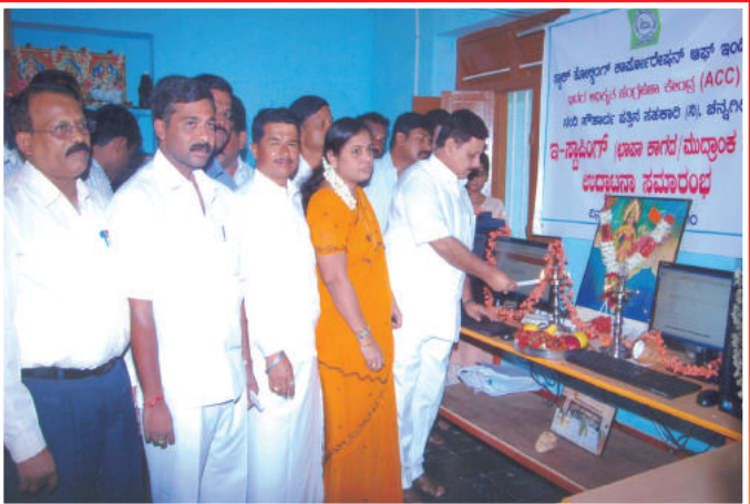
ನಂದಿ ಸೌಹಾರ್ದ ಪತ್ತಿನ ಸಹಕಾರಿ, ಚನ್ನಗಿರಿ.

ಚನ್ನಗಿರಿ ನಂದಿ ಸೌಹಾರ್ದ ಪತ್ತಿನ ಸಹಕಾರಿಯಲ್ಲಿ ಇ-ಸ್ವಾಂಪಿಂಗ್ ಉದ್ಘಾಟಿಸಲಾಯಿತು.