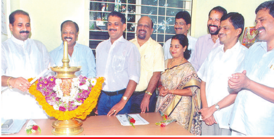
ಜನಹಿತ ಸೌಹಾರ್ದ ಸಹಕಾರಿ, ಉಡುಪಿ