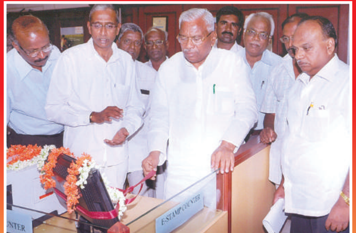
ತುಮಕೂರು ಮರ್ಚೆಂಟ್ಸ್ ಸೌಹಾರ್ದ ಸಹಕಾರಿ, ತುಮಕೂರು.

ಚನ್ನಗಿರಿ ನಂದಿ ಸೌಹಾರ್ದ ಪತ್ತಿನ ಸಹಕಾರಿಯಲ್ಲಿ ಇ-ಸ್ವಾಂಪಿಂಗ್ ಉದ್ಘಾಟಿಸಲಾಯಿತು.