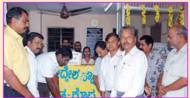
ಕೊಪ್ಪದ ಗಾಯತ್ರಿ ಸೌಹಾರ್ದ ಸಹಕಾರಿಯ ಶಾಖೆಯಲ್ಲಿ ಉದ್ಘಾಟನೆ