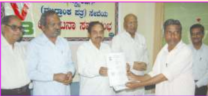
ವಿಕಾಸ ಸೌಹಾರ್ದ ಸಹಕಾರಿ ಬ್ಯಾಂಕ್ ಹೊಸಪೇಟೆಯ ಮುಖ್ಯ ಶಾಖೆಯಲ್ಲಿ ಉದ್ಘಾಟನೆ

ಏಪ್ರಿಲ್ 2010 ರಿಂದ ರಾಜ್ಯದ 57 ಸೌಹಾರ್ದ ಸಹಕಾರಿಗಳಲ್ಲಿ ಇ ಸ್ಟಾಂಪಿಂಗ್ ವ್ಯವಹಾರ ಪ್ರಾರಂಭವಾಗಿದೆ. ಸಾರ್ವಜನಿಕರಿಂದ ಈ ವ್ಯವಹಾರಕ್ಕೆ ಉತ್ತಮ ಪ್ರತಿಕ್ರಿಯೆ ದೊರಕುತ್ತಿದೆ. ಈ ತಿಂಗಳ ಅಂತ್ಯದೊಳಗೆ ಹಂತ ಹಂತವಾಗಿ ಒಟ್ಟಾರೆ 100 ಕ್ಕೂ ಹೆಚ್ಚು ಸೌಹಾರ್ದ ಸಹಕಾರಿಗಳು ಈ ವ್ಯವಹಾರವನ್ನು ಪ್ರಾರಂಭಿಸಲು ಸಿದ್ಧರಾಗಿದ್ದು ಸ್ವಾಕ ಹೊಲ್ಡಿಂಗ್ ಕಾರ್ಪೊರೇಶನ್ ಆಫ್ ಇಂಡಿಯಾದವರು ಯುಸರ್ ಐ.ಡಿ. ಸೂಪರ್‌ವೈಸರ್ ಐ.ಡಿ. ಸಂಖ್ಯೆಗಳನ್ನು ನೀಡಿದ ನಂತರ ಈ ವ್ಯವಹಾರಕ್ಕೆ ಚಾಲನೆ ಸಿಗುತ್ತದೆ.