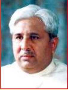
ಕರ್ನಾಟಕ ರಾಜ್ಯ ಪಟ್ಟಣ ಸಹಕಾರ ಬ್ಯಾಂಕುಗಳ ಮಹಾಮಂಡಳದ ಅಧ್ಯಕ್ಷರಾಗಿ ಶ್ರೀ ಹೆಚ್.ಕೆ.ಪಾಟೀಲ್, ಉಪಾಧ್ಯಕ್ಷರಾಗಿ ಶ್ರೀ ಪಾಟೀಲ್