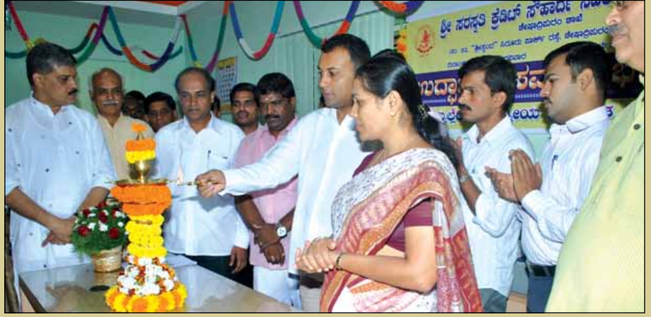
ಪುತ್ತೂರಿನ ಶ್ರೀ ಸರಸ್ವತಿ ಕ್ರೆಡಿಟ್ ಸೌಹಾರ್ದ ಸಹಕಾರಿಯ 7ನೇ ಶಾಖೆ ಬೆಂಗಳೂರಿನಲ್ಲಿ ಇಂಧನ ಸಚಿವೆ ಶೋಭಾ ಕರಂದ್ಲಾಜೆಯವರಿಂದ ಉದ್ಘಾಟನೆ.