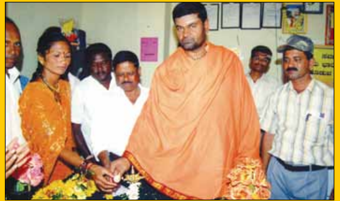
ನವಕರ್ನಾಟಕ ಪತ್ತಿನ ಸೌಹಾರ್ದ ಸಹಕಾರಿ ಶಿಗ್ಗಾವದಲ್ಲಿ ಇ-ಸ್ಪಾಂಪಿಂಗ್ ವ್ಯವಹಾರ ಪ್ರಾರಂಭ.