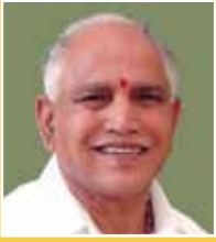
ಶ್ರೀ ಬಿ.ಎಸ್.ಯಡಿಯೂರಪ್ಪ ಮಾನ್ಯ ಮುಖ್ಯ ಮಂತ್ರಿಗಳು

ರಾಜ್ಯದ ಸೌಹಾರ್ದ ಸಹಕಾರ ಚಳುವಳಿಯ ದಶಮಾನೋತ್ಸವ ಹಾಗೂ ಸೌಹಾರ್ದ ಸಹಕಾರಿ ದಿನಾಚರಣೆಯ ಅಂಗವಾಗಿ ನೂತನ ವರ್ಷದ ಸೌಹಾರ್ದ ಸಹಕಾರಿಗಳಿಗಲ್ಲ ಶುಭಾಶಯಗಳು. ರಾಜ್ಯದ ಸೌಹಾರ್ದ ಸಹಕಾರಿ ಬೆಳವಣಿಗೆಗೆ ರಾಜ್ಯ ಸರ್ಕಾರದ ಸಂಪೂರ್ಣ ಬೆಂಬಲವಿದೆ. ಸದಸ್ಯರ ಹಾಗೂ ಸಾರ್ವಜನಿಕರ ಆಶೋತ್ತರಗಳಿಗೆ ಸ್ಪಂದಿಸಿ ಕಾರ್ಯನಿರ್ವಹಿಸಬೇಕೆಂದು ಆಶಿಸುತ್ತೇನೆ.