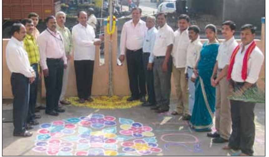
ಆರ್ಥಿಕ ಸಂಘಟನೆಗಳು ಎಂದು ಗುರುತಿಸಬೇಕು ಈ ಬಗ್ಗೆ ನಾವೆಲ್ಲರೂ ಒಂದಾಗಿ ಕಾರ್ಯ ನಿರ್ವಹಿಸೋಣ ಎಂದು ಕರೆ ನೀಡಿದರು.

ನಂತರದಲ್ಲಿ ಅಧ್ಯಕ್ಷರು ಮಾತನಾಡಿ ಕರ್ನಾಟಕದಲ್ಲಿ 2001 ರಲ್ಲಿ ಸೌಹಾರ್ದ ಸಹಕಾರಿ ಕಾಯ್ದೆ ಜನವರಿ 1 ರಂದು ಜಾರಿಗೆ ಬಂದಿದೆ. ಅದರ ಜ್ಞಾಪಕಾರ್ಥವಾಗಿ ಜನವರಿ 1 ರಂದು ಸೌಹಾರ್ದ ಸಹಕಾರಿ ದಿನವನ್ನಾಗಿ ಆಚರಿಸಲಾಗುತ್ತದೆ ರಾಜ್ಯಾದ್ಯಂತ ಎಲ್ಲ ಸೌಹಾರ್ದ ಸಹಕಾರಿಗಳು ಈ ದಿನವನ್ನು ಆಚರಿಸುವುದರ ಮೂಲಕ ಸೌಹಾರ್ದ ಸಹಕಾರಿಗಳು ಸಮಾಜದಲ್ಲಿ ತಮ್ಮನ್ನು ಗುರುತಿಸಿಕೊಳ್ಳುವಂತಾಗಬೇಕು ನಮ್ಮ ಅಸ್ತಿತ್ವದ ಬಗ್ಗೆ ಸಮಾಜದಲ್ಲಿ ಅವಿವೇಕ ಮೂಡಬೇಕು. ಸಹಕಾರಿಗಳು ಇದೊಂದು ಉತ್ತಮ