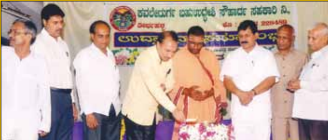
ಶಿವಮೊಗ್ಗ ಜಿಲ್ಲೆಯ ಕವಲೇದುರ್ಗ ಬಹು ಉದ್ದೇಶಿ ಸೌಹಾರ್ದ ಸಹಕಾರಿಯ ಉದ್ಘಾಟನಾ ಸಮಾರಂಭ.