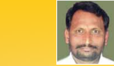
ಶ್ರೀ ಲಕ್ಷ್ಮಣ ಸವದಿ ಮಾನ್ಯ ಸಹಕಾರ ಮಂತ್ರಿಗಳು

ರಾಜ್ಯದ ಸೌಹಾರ್ದ ಸಹಕಾರ ಚಳುವಳಿಯ ದಶಮಾನೋತ್ಸವ ಹಾಗೂ ಸೌಹಾರ್ದ ಸಹಕಾರಿ ದಿನಾಚರಣೆಯ ಅಂಗವಾಗಿ ನೂತನ ವರ್ಷದ ಸೌಹಾರ್ದ ಸಹಕಾರಿಗಳಿಗಲ್ಲ ಶುಭಾಶಯಗಳು. ರಾಜ್ಯದ ಸೌಹಾರ್ದ ಸಹಕಾರಿ ಬೆಳವಣಿಗೆಗೆ ರಾಜ್ಯ ಸರ್ಕಾರದ ಸಂಪೂರ್ಣ ಬೆಂಬಲವಿದೆ. ಸದಸ್ಯರ ಹಾಗೂ ಸಾರ್ವಜನಿಕರ ಆಶೋತ್ತರಗಳಿಗೆ ಸ್ಪಂದಿಸಿ ಕಾರ್ಯನಿರ್ವಹಿಸಬೇಕೆಂದು ಆಶಿಸುತ್ತೇನೆ.