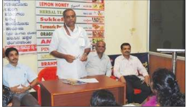
ಕದಂಬ ಸೌಹಾರ್ದ ಸಹಕಾರಿಯ ಅಧ್ಯಯನ