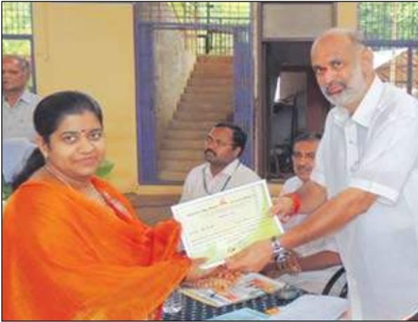
ಪ್ರಶಸ್ತಿ ಪತ್ರ ವಿತರಣೆ