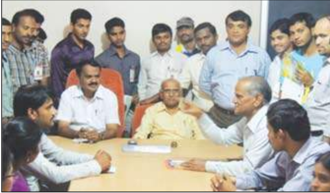
ಯು.ಕೆ. ಸೌಹಾರ್ದ ಸಹಕಾರಿಗೆ ಭೇಟಿ

ಪ್ರಾಯೋಗಿಕ - 1ರಲ್ಲಿ ಆಡಳಿತ ಸಮಿತಿ ಸಭೆಯ ನೋಟೀಸು ಸಿದ್ಧಪಡಿಸುವುದು, ಸಭೆಗಳನ್ನು ನಡೆಸುವುದು, ನಡವಳಿಕೆಗಳನ್ನು ಬರೆಯುವುದರ ಬಗ್ಗೆ ತಿಳುವಳಿಕೆ ನೀಡಲಾಯಿತು. ಪ್ರಾಯೋಗಿಕ - 2ರಲ್ಲಿ ಲೆಕ್ಕಪತ್ರಗಳನ್ನು ಇಡುವ ವಿಧಾನ, ರಶೀದಿ,ವೋಚರ,ನಗದು ಪುಸ್ತಕ, ಜನರಲ್ ಲೆಡ್ಜರ್ ಜಮಾಖಚು,ಟ್ರಿಯಲ್ ಬ್ಯಾಲೆನ್ಸ್ ಸಿದ್ಧಪಡಿಸುವುದು ಹಾಗೂ ಅಂತಿಮ ಲೆಕ್ಕ ಪತ್ರಗಳನ್ನು ಸಿದ್ಧಪಡಿಸುವ ಬಗ್ಗೆ ತಿಳುವಳಿಕೆ ನೀಡಲಾಯಿತು.