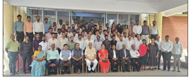
ಗಣ್ಯರೊಂದಿಗೆ ಭಾಗವಹಿಸಿದ ಲೆಕ್ಕಪರಿಶೋಧಕರು

ಕಾರ್ಯಕ್ರಮವನ್ನು ಉದ್ಘಾಟಿಸಿ ಮಾತನಾಡಿದ ಶ್ರೀಯುತರು ಸಹಕಾರ ಸಂಸ್ಥೆಗಳನ್ನು ಲೆಕ್ಕ ಪರಿಶೋಧನೆ ಮಾಡುವ ಸಂದರ್ಭದಲ್ಲಿ ಅನೇಕ ವಿಷಯಗಳ ಕಡೆಗೆ ಗಮನ ಹರಿಸಬೇಕಾಗುತ್ತದೆ. ವಿಶೇಷವಾಗಿ ಸಂಸ್ಥೆಯ ಸದಸ್ಯರ ಹಿತರಕ್ಷಣೆಗೆ ಆದ್ಯತೆ ನೀಡುವುದು ಅಗತ್ಯ. ಠೇವಣಿಗಳ ಹೂಡುವಿಕೆ, ಸಾಲ ನಿಡುವಿಕೆಗಳಲ್ಲಿ ಪಾರದರ್ಶಕತೆ ಬಂಗಾರದ ಸಾಲ ನೀಡಿರುವ ಬಗ್ಗೆ ಗಮನ ಹರಿಸುವುದು, ಕಾನೂನು ಸಲಹೆಗಳನ್ನು ಪಡೆದಿರುವುದು, ವ್ಯಾಲ್ಯುಯೇಶನ್ ರಿಪೋರ್ಟ್‌ಗಳನ್ನು, ಕೂಲಂಕುಷವಾಗಿ ಪರಿಶೀಲಿಸಬೇಕಾಗುತ್ತದೆ. ನಡೆದಿರುವ ಎಲ್ಲ ವ್ಯವಹಾರಗಳ ನೈಜತೆಯನ್ನು ಪರಿಶೀಲಿಸಿ ವರದಿ ನೀಡುವುದು ಅವಶ್ಯಕ ಎಂದು ತಿಳಿಸಿ ಹಲವಾರು ಉದಾಹರಣೆಗಳನ್ನು ನೀಡಿದರು. ಸದಸ್ಯರಿಗೆ ಸಲ್ಲಿಸಬಹುದಾದ ಸೇವೆಗಳ ನಿರ್ವಹಣೆಯ ಬಗ್ಗೆ ಪರಿಶೀಲಿಸಬೇಕಾಗುತ್ತದೆ. ಸಹಕಾರ ಸಂಸ್ಥೆಗಳು ಏಕ ವ್ಯಕ್ತಿಯ ಹತೋಟಿಯಲ್ಲಿರದಂತೆ, ಸಲಹೆಗಳನ್ನು ನೀಡಬೇಕಾಗುತ್ತದೆ. ಹಣ ದುರುಪಯೋಗ ಹಣಕಾಸು ಶಿಸ್ತು ಪಾಲಿಸಿರುವ