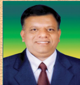
ಜಿ. ಹೆಚ್. ಹೆಚ್. ಪುಷ್ಪಾಕ್ಷರಿ ನಿರ್ದೇಶಕರು