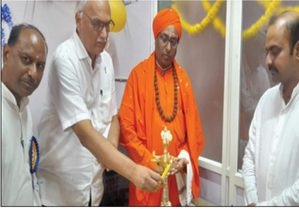
ಬೆಂಗಳೂರು : ದಿನಾಂಕ 25.05.2024ರಂದು ಶ್ರೀ ವೀರಸನ್ಯಾಸಿ