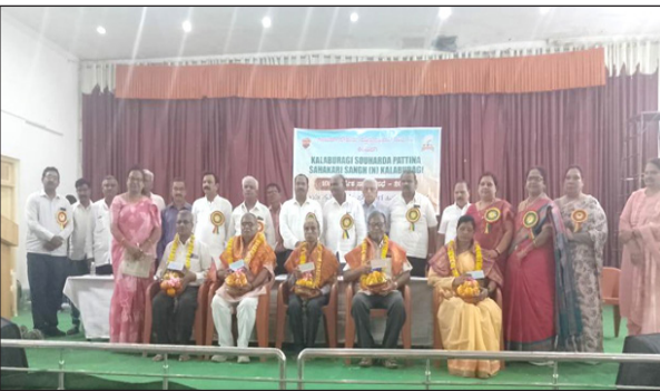
ಕಲಬುರಗಿ : ದಿನಾಂಕ 12.05.2024 ರಂದು ಕಲಬುರಗಿ ಸೌಹಾರ್ದ