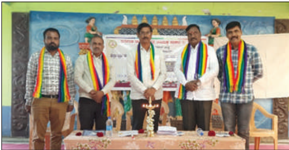
ಕೊಪ್ಪಳ : ದಿನಾಂಕ 28.11.2024 ರಂದು ಕೊಪ್ಪಳ ಜಿಲ್ಲೆಯ ಕಾರಟಗಿ ತಾಲೂಕಿನ ಸೌಹಾರ್ದ ಸಹಕಾರಿಗಳ ಅಧ್ಯಕ್ಷರು ಹಾಗೂ

ದೆಹಲಿಯಲ್ಲಿ ನಡೆದ ಅಂತರರಾಷ್ಟ್ರೀಯ ವಿಶ್ವ ಸಹಕಾರಿ ಸಮಾವೇಶ ಈ ಎಲ್ಲಾ ಉದ್ದೇಶಗಳ ಸಾಧನೆಗಾಗಿ ಹಲವಾರು ಪ್ರಸ್ತಾವನೆಗಳನ್ನು ಮಂಡಿಸಿದೆ, ಸುಧೀರ್ಘವಾಗಿ ಚರ್ಚೆಗಳು ನಡೆದಿವೆ, ಅನೇಕ ಉತ್ತಮ ನಿರ್ಣಯಗಳು ಆಗಿವೆ, ಈ ಎಲ್ಲಾ ಬೆಳಗವಣಿಗೆಗಳ ಹಿನ್ನೆಲೆಯಲ್ಲಿ ಸಹಕಾರ ಕ್ಷೇತ್ರದ ಅಭಿವೃದ್ಧಿಗೆ ಸುಮಾರು ಕಾಲ ಬರಲಿದೆ ಎಂಬುದನ್ನು ಅಪೇಕ್ಷಿಸಬಹುದು.