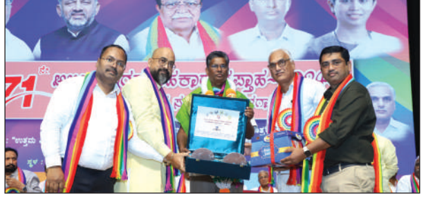
ಮಾನ್ಯ ಸಚಿವರಾದ ಶ್ರೀ ಸತೀಶ ಲ. ಜಾರಕಿಹೊಳಿ ಇವರಿಗೆ ಸನ್ಮಾನ