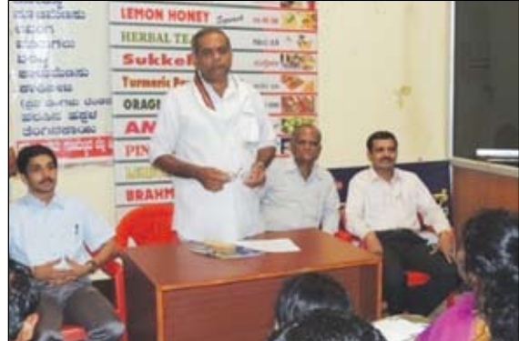
ಕದಂಬ ಸೌಹಾರ್ದ ಸಹಕಾರಿಯ ಅಧ್ಯಯನ