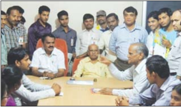
ಯು.ಕೆ. ಸೌಹಾರ್ದ ಸಹಕಾರಿಗೆ ಭೇಟಿ

ಪ್ರಾಯೋಗಿಕ - 1ರಲ್ಲಿ ಆಡಳಿತ ಸಮಿತಿ ಸಭೆಯ ನೋಟೀಸು ಸಿದ್ಧಪಡಿಸುವುದು, ಸಭೆಗಳನ್ನು ನಡೆಸುವುದು, ನಡವಳಿಕೆಗಳನ್ನು ಬರೆಯುವುದರ ಬಗ್ಗೆ ತಿಳುವಳಿಕೆ ನೀಡಲಾಯಿತು. ಪ್ರಾಯೋಗಿಕ - 2ರಲ್ಲಿ ಲೆಕ್ಕಪತ್ರಗಳನ್ನು ಇಡುವ ವಿಧಾನ, ರಶೀದಿ,ವೋಚರ,ನಗದು ಪುಸ್ತಕ, ಜನರಲ್ ಲೆಡ್ಜರ್ ಜಮಾಖಚು,ಟ್ರಿಯಲ್ ಬ್ಯಾಲೆನ್ಸ್ ಸಿದ್ಧಪಡಿಸುವುದು ಹಾಗೂ ಅಂತಿಮ ಲೆಕ್ಕ ಪತ್ರಗಳನ್ನು ಸಿದ್ಧಪಡಿಸುವ ಬಗ್ಗೆ ತಿಳುವಳಿಕೆ ನೀಡಲಾಯಿತು.