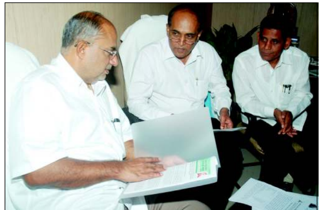
ಸೌಹಾರ್ದ ಸಹಕಾರಿ ಕಾಯ್ದೆಯ ಲೋಪದೋಷಗಳ ತಿದ್ದುಪಡಿಗಾಗಿ ಸಚಿವರಲ್ಲಿ ಮನವಿ ಹಾಗೂ ಸಮಾಲೋಚನೆ.