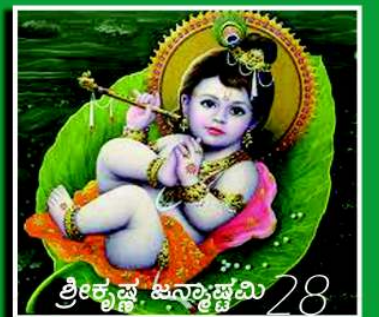
ಶ್ರೀಕೃಷ್ಣ ಜನ್ಮಾಷ್ಟಮಿ 28