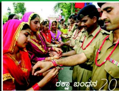
ರಕ್ಷಾ ಬಂಧನ 20