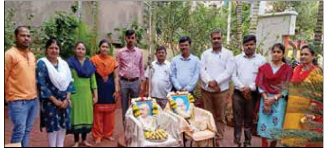
ಬೆಳಗಾವಿ ಪ್ರಾಂತೀಯ ಕಛೇರಿ