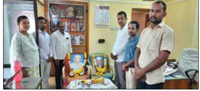
ಕಲಬುರಗಿ ಪ್ರಾಂತೀಯ ಕಛೇರಿ