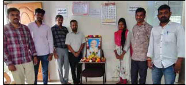
ಸೌಹಾರ್ದ ದಾವಾ ಪಂಚಾಯತಿ ನ್ಯಾಯಾಲಯ