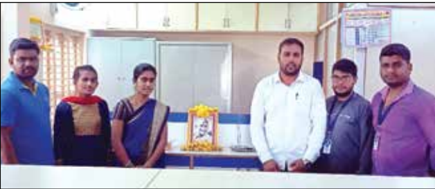
ಕೋಲಾರ ಜಿಲ್ಲಾ ಸಂಪರ್ಕ ಕಛೇರಿ