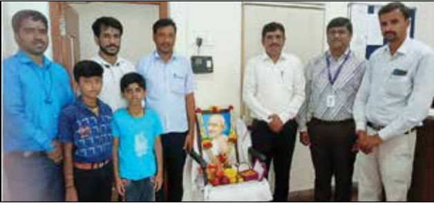
ಮೈಸೂರು ಪ್ರಾಂತೀಯ ಕಛೇರಿ