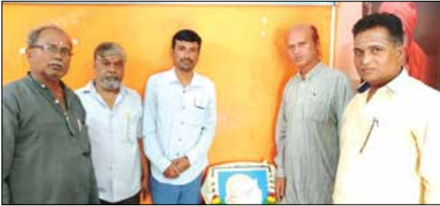
ಜೀವರ ಜಿಲ್ಲಾ ಸಂಪರ್ಕ ಕಛೇರಿ