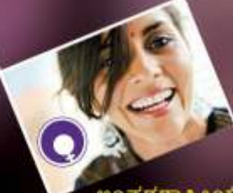
ಅಂತರರಾಷ್ಟ್ರೀಯ ಮಹಿಳಾ ದಿನ