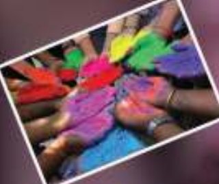
ಕಾಮನಹಬ್ಬ ಹೋಳಿ ಹುಣ್ಣಿಮೆ