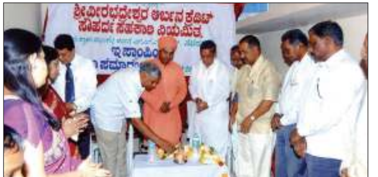
ಶ್ರೀ ವೀರಭದ್ರೇಶ್ವರ ಅರ್ಬನ್ ಕ್ರೆಡಿಟ್ ಸೌಹಾರ್ದ ಸಹಕಾರಿಯಲ್ಲಿ ನೂತನ ಇ-ಸ್ವಾಂಪಿಂಗ್ ಉದ್ಘಾಟನಾ ಕಾರ್ಯಕ್ರಮದ ಭಾವಚಿತ್ರ.