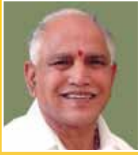
ಶ್ರೀ ಬಿ.ಎಸ್.ಯಡಿಯೂರಪ್ಪ ಮಾನ್ಯ ಮುಖ್ಯ ಮಂತ್ರಿಗಳು

ರಾಜ್ಯದ ಸೌಹಾರ್ದ ಸಹಕಾರ ಚಳುವಳಿಯ ದಶಮಾನೋತ್ಸವ ಹಾಗೂ ಸೌಹಾರ್ದ ಸಹಕಾರಿ ದಿನಾಚರಣೆಯ ಅಂಗವಾಗಿ ನೂತನ ವರ್ಷದ ಸೌಹಾರ್ದ ಸಹಕಾರಿಗಳಿಗಲ್ಲ ಶುಭಾಶಯಗಳು. ರಾಜ್ಯದ ಸೌಹಾರ್ದ ಸಹಕಾರಿ ಬೆಳವಣಿಗೆಗೆ ರಾಜ್ಯ ಸರ್ಕಾರದ ಸಂಪೂರ್ಣ ಬೆಂಬಲವಿದೆ. ಸದಸ್ಯರ ಹಾಗೂ ಸಾರ್ವಜನಿಕರ ಆಶೋತ್ತರಗಳಿಗೆ ಸ್ಪಂದಿಸಿ ಕಾರ್ಯನಿರ್ವಹಿಸಬೇಕೆಂದು ಆಶಿಸುತ್ತೇನೆ.