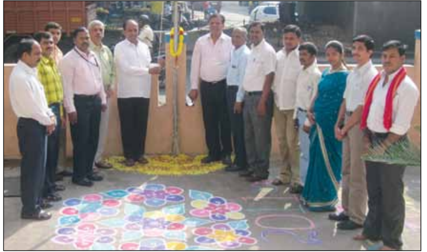
ಆರ್ಥಿಕ ಸಂಘಟನೆಗಳು ಎಂದು ಗುರುತಿಸಬೇಕು ಈ ಬಗ್ಗೆ ನಾವೆಲ್ಲರೂ ಒಂದಾಗಿ ಕಾರ್ಯ ನಿರ್ವಹಿಸೋಣ ಎಂದು ಕರೆ ನೀಡಿದರು.

ನಂತರದಲ್ಲಿ ಅಧ್ಯಕ್ಷರು ಮಾತನಾಡಿ ಕರ್ನಾಟಕದಲ್ಲಿ 2001 ರಲ್ಲಿ ಸೌಹಾರ್ದ ಸಹಕಾರಿ ಕಾಯ್ದೆ ಜನವರಿ 1 ರಂದು ಜಾರಿಗೆ ಬಂದಿದೆ. ಅದರ ಜ್ಞಾಪಕಾರ್ಥವಾಗಿ ಜನವರಿ 1 ರಂದು ಸೌಹಾರ್ದ ಸಹಕಾರಿ ದಿನವನ್ನಾಗಿ ಆಚರಿಸಲಾಗುತ್ತದೆ ರಾಜ್ಯಾದ್ಯಂತ ಎಲ್ಲ ಸೌಹಾರ್ದ ಸಹಕಾರಿಗಳು ಈ ದಿನವನ್ನು ಆಚರಿಸುವುದರ ಮೂಲಕ ಸೌಹಾರ್ದ ಸಹಕಾರಿಗಳು ಸಮಾಜದಲ್ಲಿ ತಮ್ಮನ್ನು ಗುರುತಿಸಿಕೊಳ್ಳುವಂತಾಗಬೇಕು ನಮ್ಮ ಅಸ್ತಿತ್ವದ ಬಗ್ಗೆ ಸಮಾಜದಲ್ಲಿ ಅವಿವೇಕ ಮೂಡಬೇಕು. ಸಹಕಾರಿಗಳು ಇದೊಂದು ಉತ್ತಮ