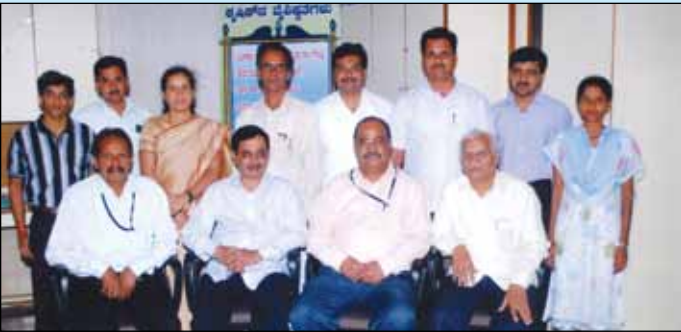
ನಾಗರದ ಕೃಷಿಕ ಸೌಹಾರ್ದ ಸಹಕಾರಿಗೆ ಆರ್.ಬಿ.ಬಿ. ಅಧಿಕಾರಿಗಳ ಭೇಟಿ