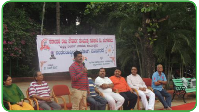
ಅಂತರಾಷ್ಟೀಯ ಯೋಗ ದಿನಾಚರಣೆ