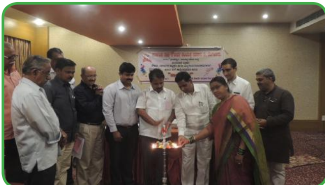
ಆದಾಯ ತೆರಿಗೆ ಕುರಿತು ತರಬೇತಿ ಉದ್ಘಾಟನೆ ಹಾಗೂ ಭಾಗವಹಿಸಿದ ಪ್ರತಿನಿಧಿಗಳು