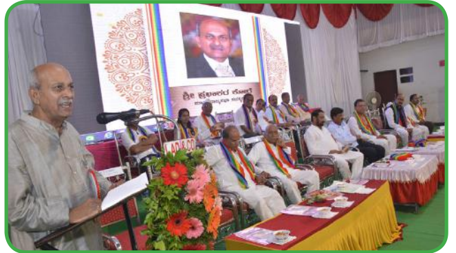
ರಾಜ್ಯದ ಸೌಹಾರ್ದ ಸಹಕಾರಿಗಳ ದಾವಾ ಪಂಚಾಯಿತ ನ್ಯಾಯಾಲಯದ ಸಂಚಾರಿ ನ್ಯಾಯಾಪೀಠಗಳ ಉದ್ಘಾಟನಾ ಕಾರ್ಯಕ್ರಮದಲ್ಲಿ ಸಹಕಾರಿ ಧುರೀಣರು