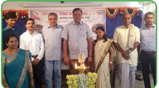
ಮುಖ್ಯಕಾರ್ಯನಿರ್ವಾಹಕರ "ವಾರ್ಷಿಕ ಪ್ರಗತಿ ಪರಿಶೀಲನಾ ಸಭೆ"