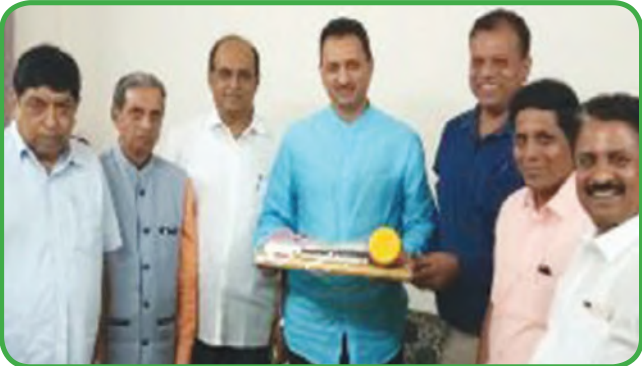
ಕೇಂದ್ರ ಸರ್ಕಾರದ ಕೌಶಲ್ಯಾಭಿವೃದ್ಧಿ ಸಚಿವರಾದ ಶ್ರೀ ಅನಂತಕುಮಾರ ಹೆಗಡೆಯವರನ್ನು ಭೇಟಿ ಮಾಡಿ ಮನವಿ ಸಲ್ಲಿಕೆ