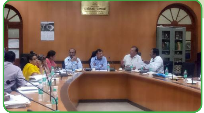
ಮಾನ್ಯ ಸಹಕಾರಿಗಳ ನಿಬಂಧಕರ ಸಭೆ

ಸದರಿ ತರಬೇತಿಗಳಲ್ಲಿ 117 ಸೌಹಾರ್ದ ಸಹಕಾರಿಗಳಿಂದ 198 ಪ್ರತಿನಿಧಿಗಳು ಭಾಗವಹಿಸಿರುತ್ತಾರೆ.