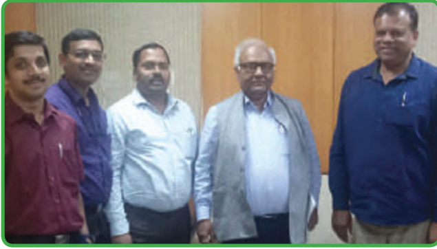
ಆದಾಯ ತೆರಿಗೆ ಪ್ರಧಾನ ಮುಖ್ಯ ಆಯುಕ್ತರು, ಗೋವಾ ಮತ್ತು ಕರ್ನಾಟಕ ಇವರ ಭೇಟಿ