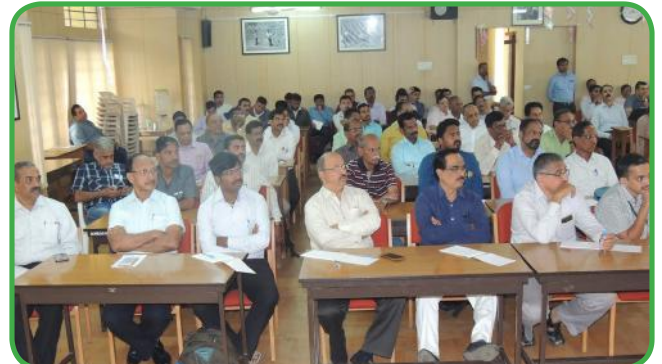
ಸಾಫ್ಟ್‌ವೇರ್ ಡೆಮೋ ಉದ್ಘಾಟನಾ ಕಾರ್ಯಕ್ರಮ ಹಾಗೂ ಭಾಗವಹಿಸಿದ ಸಹಕಾರಿ ಧುರೀಣರು