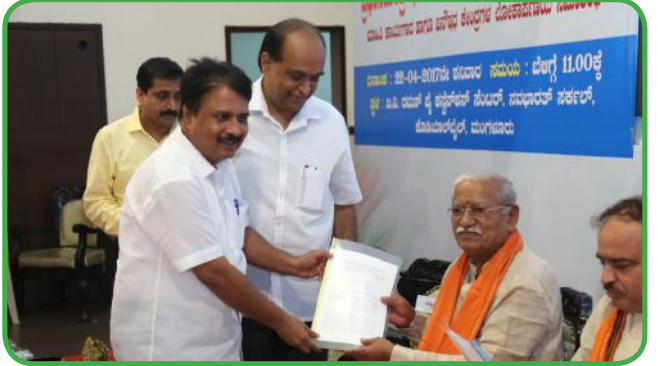
ಜನೌಷಧಿ ಯೋಜನೆ ಕುರಿತು ಸೌಹಾರ್ದ ಸಹಕಾರಿಗಳಲ್ಲಿ ಅಳಡಿಕೆಗಾಗಿ ಮನವಿ