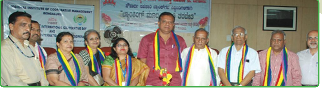
ಪಟ್ಟಣ ಸೌಹಾರ್ದ ಸಹಕಾರಿ ಬ್ಯಾಂಕುಗಳ ಸಿಬ್ಬಂದಿಯವರಿಗಾಗಿ 7 ದಿನಗಳ ಬ್ಯಾಂಕಿಂಗ್ ಮೂಲ ಮಾಹಿತಿ ತರಬೇತಿ