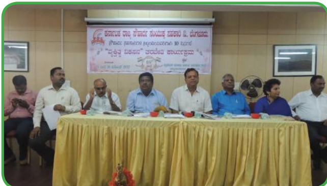
10ದಿನಗಳ ವ್ಯಕ್ತಿತ್ವ ವಿಕಸನ ತರಬೇತಿ ಉದ್ಘಾಟನೆ ಕಾರ್ಯಕ್ರಮದಲ್ಲಿ ಅತಿಥಿ ಗಣ್ಯರು