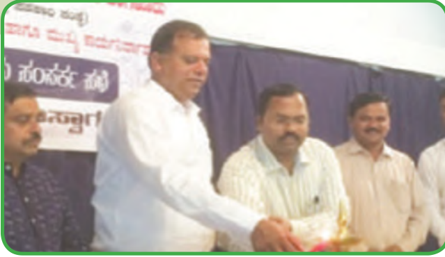
ಕಲಬುರಗಿ ಪ್ರಾಂತೀಯ ಸೌಹಾರ್ದ ಸಹಕಾರಿಗಳ ಸಂಪರ್ಕ ಕ್ಷೇತ್ರ