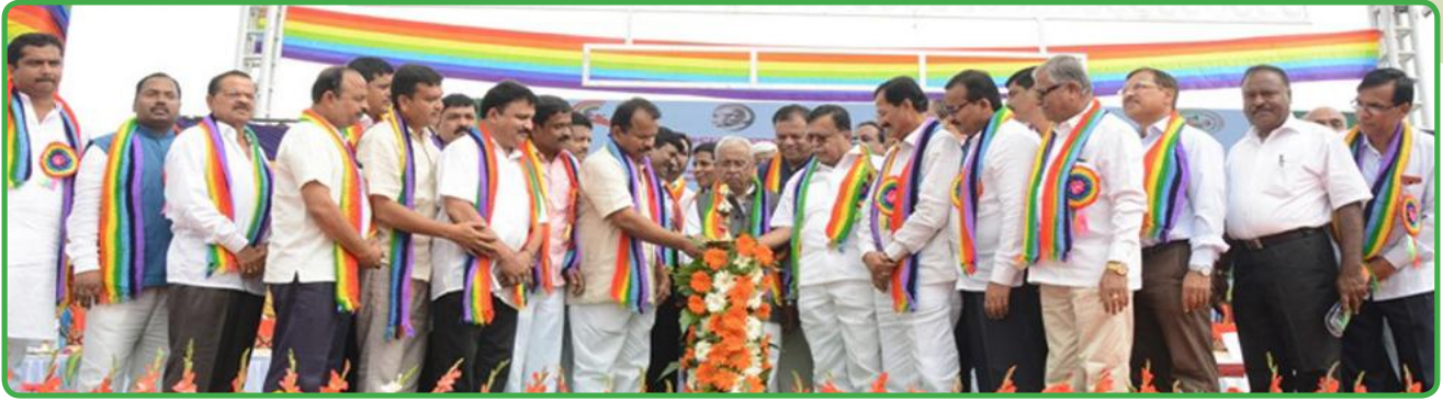
ಸಹಕಾರಿ ಸಪ್ತಾಹ ಉದ್ಘಾಟನೆ

ತಂತ್ರಾಂಶವನ್ನು ಅಳವಡಿಸಲು ಹಾಗೂ ಐಡಿಗಳ ನಿರ್ವಹಣೆಯಲ್ಲಿ ನಿಧಾನವಾಗುತ್ತಿರುವುದರಿಂದ ಆಗುತ್ತಿರುವ ತೊಂದರೆಗಳನ್ನು ತಿಳಿಸಿ, ಇವುಗಳ ನಿವಾರಣೆಗೆ ಕ್ರಮವಿಡಬೇಕೆಂದು ಕೋರಿದರು.