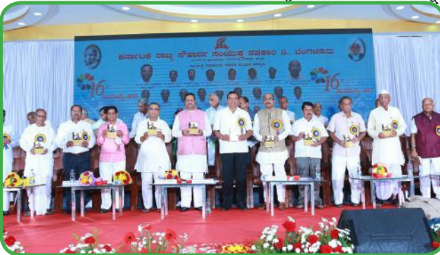
ಸಂಯುಕ್ತ ಸಹಕಾರಿಯ ಪ್ರಕಟಣೆಗಳ ಬಿಡುಗಡೆ

● ಸಂಯುಕ್ತ ಸಹಕಾರಿಯ ಸಾಫ್ಟ್‌ವೇರ್ - ಆನ್‌ಲೈನ್ ವ್ಯೂವಿಂಗ್ ಸೌಲಭ್ಯ : ಸಂಯುಕ್ತ ಸಹಕಾರಿಯು ತಂತ್ರಜ್ಞಾನವನ್ನು ಅಳವಡಿಸಿಕೊಳ್ಳುವ ಉದ್ದೇಶದಿಂದ ತನ್ನದೇ ಆದ ಸಾಫ್ಟ್‌ವೇರ್ ಅನ್ನು ಹೊಂದಿ, ರಾಜ್ಯದ ಎಲ್ಲಾ ಸೌಹಾರ್ದ ಸಹಕಾರಿಗಳ ಮಾಹಿತಿಗಳನ್ನು ಮತ್ತು ಇಂದೀಕರಿಸಿದ ಮಾಹಿತಿಗಳನ್ನು ಸಂಯುಕ್ತ ಸಹಕಾರಿಯ ಆಡಳಿತ ಮಂಡಲಿಯ ಎಲ್ಲಾ ಸದಸ್ಯರು ಹಾಗೂ ಸೌಹಾರ್ದ ಅಭಿವೃದ್ಧಿ ಅಧಿಕಾರಿಗಳು ಆನ್‌ಲೈನ್‌ನಲ್ಲಿ ವ್ಯೂವಿಂಗ್ ಮಾಡುವಂತೆ ಸಿದ್ಧಪಡಿಸಲಾಗುತ್ತಿದೆ.