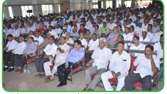
ರಾಜ್ಯದ ಸೌಹಾರ್ದ ಸಹಕಾರಿಗಳ ದಾವಾ ಪಂಚಾಯಿತ ನ್ಯಾಯಾಲಯದ ಬೆಳಗಾವಿ, ಕಲಬುರಗಿ ಹಾಗೂ ಮೈಸೂರು ವಿಭಾಗಗಳ ಸಂಚಾರಿ ನ್ಯಾಯಾಪೀಠಗಳ ಉದ್ಘಾಟನೆ

2017ರಂದು ಬೀದರ ಜಿಲ್ಲೆಯ ಎಲ್ಲಾ ಸೌಹಾರ್ದ ಸಹಕಾರಿಗಳ ಅಧ್ಯಕ್ಷರು ಹಾಗೂ ಮುಖ್ಯಕಾರ್ಯನಿರ್ವಾಹಕರುಗಳಿಗಾಗಿ ಬೀದರ ಜಿಲ್ಲೆಯಲ್ಲಿ ವಿಷಯಾಧಾರಿತ 1 ತರಬೇತಿಯನ್ನು ಆಯೋಜಿಸಲಾಗಿತ್ತು. ತರಬೇತಿಯಲ್ಲಿ 30 ಸೌಹಾರ್ದ ಸಹಕಾರಿಗಳಿಂದ 68 ಸಹಕಾರಿ ಪ್ರತಿನಿಧಿಗಳು ಭಾಗವಹಿಸಿರುತ್ತಾರೆ.