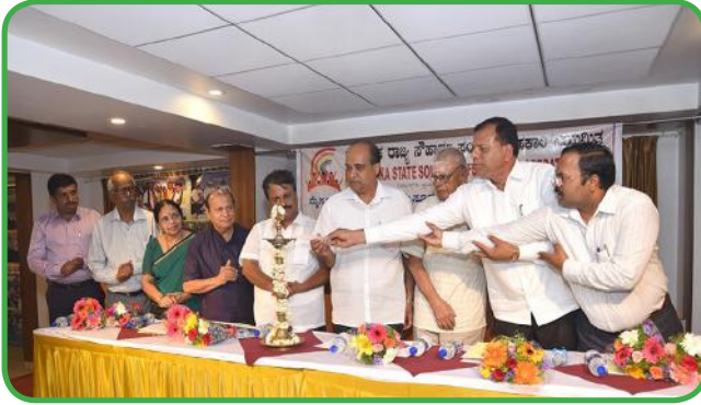
ರಾಜ್ಯದ ಸೌಹಾರ್ದ ಸಹಕಾರಿಗಳ ಹಾಗೂ ಸಂಯುಕ್ತ ಸಹಕಾರಿಯ ಕಾರ್ಯಚಟುವಟಿಕೆಗಳ ಮೌಲ್ಯಮಾಪನ ಹಸ್ತಾಂತರ-ಉದ್ಘಾಟನೆ

ಶ್ರೀ ಬಸನಗೌಡ ಪಾಟೀಲ್ ಯತ್ನಾಳರವರು ನೆರವೇರಿಸಿದರು. ಉದ್ಘಾಟನಾ ಕಾರ್ಯಕ್ರಮದಲ್ಲಿ ಸಂಯುಕ್ತ ಸಹಕಾರಿಯ ಪದಾಧಿಕಾರಿಗಳು ಹಾಗೂ ನಿರ್ದೇಶಕರು, ಸೌಹಾರ್ದ ಸಹಕಾರಿಯ ಸದಸ್ಯ ಪ್ರತಿನಿಧಿಗಳು ಉಪಸ್ಥಿತರಿದ್ದರು.