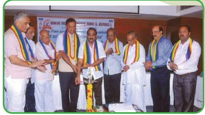
ಪಟ್ಟಣ ಸಹಕಾರಿ ಬ್ಯಾಂಕ್ ಗಳ ಪದಾಧಿಕಾರಿಗಳ ತರಬೇತಿಯ ಉದ್ಘಾಟನೆ

ಮತ್ತು ನೈರ್ಮಲ್ಯ ಖಾತೆ ಸಚಿವರಾದ ಶ್ರೀ ರಮೇಶ್ ಜಿಗಜಿಣ-ಗಿಯವರಿಗೆ ಮನವಿ ಸಲ್ಲಿಸಿದರು.