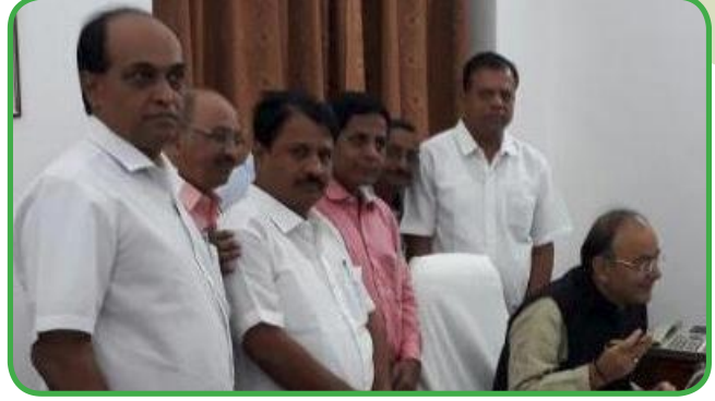
ಮಾನ್ಯ ಕೇಂದ್ರ ಹಣಕಾಸು ಸಚಿವ ಶ್ರೀ ಅರುಣ್‌ಜೇಟ್ಟಿಯವರನ್ನು ಸಂಯುಕ್ತ ಸಹಕಾರಿಯ ನಿರ್ದೇಶಕರ ಬೇಟಿ ಹಾಗೂ ಮನವಿ.

ಚುನಾವಣಾ ಆಯೋಗಕ್ಕೆ ಒದಗಿಸಿ, ನಿಗದಿತ ಸಮಯದಲ್ಲಿ ಚುನಾವಣೆಗಳು ನಡೆಯುವಂತೆ ಮಾಡಲು ಪ್ರಯತ್ನಿಸಲಾಗಿದೆ. ಸೌಹಾರ್ದ ಸಹಕಾರಿಗಳಿಗೆ ಚುನಾವಣೆ ಕುರಿತು ತರಬೇತಿ ನೀಡಲಾಗಿದೆ ಮತ್ತು ನಿಗದಿತ ಸಮಯದಲ್ಲಿ ಚುನಾವಣೆ ನಡೆಸದಿರುವ ಸೌಹಾರ್ದ ಸಹಕಾರಿಗಳ ವಿರುದ್ಧ ಕಾನೂನಿನನ್ವಯ ಕ್ರಮ ತೆಗೆದುಕೊಳ್ಳಲಾಗಿದೆ.