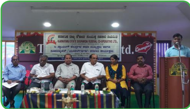
ಇ-ಸ್ಟಾಂಪಿಂಗ್ ತರಬೇತಿ ಕಾರ್ಯಕ್ರಮಗಳ ಉದ್ಘಾಟನೆ ಹಾಗೂ ಇ-ಸ್ಟಾಂಪಿಂಗ್ ಮಾಹಿತಿ ಕೈಪಿಡಿ ಬಿಡುಗಡೆ