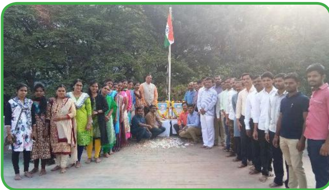
ಸಂಯುಕ್ತ ಸಹಕಾರಿಯಲ್ಲಿ ಗಣರಾಜ್ಯೋತ್ಸವ ದಿನಾಚರಣೆ