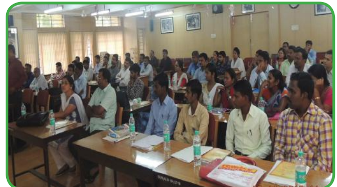
10ದಿನಗಳ ವ್ಯಕ್ತಿತ್ವ ವಿಕಸನ ತರಬೇತಿಯಲ್ಲಿ ಭಾಗವಹಿಸಿದ ಪತ್ರಿನಿಧಿಗಳು