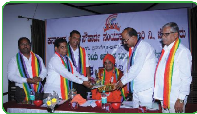
ಸಂಯುಕ್ತ ಸಹಕಾರಿಯ ಆಡಳಿತ ಮಂಡಳಿ ಸದಸ್ಯರ ತರಬೇತಿಯಲ್ಲಿ ಶ್ರೀ ಶ್ರೀ ತ್ರೀನೇತ್ರದತ್ತ ಮಹಾಂತ ಸ್ವಾಮಿಜಿ