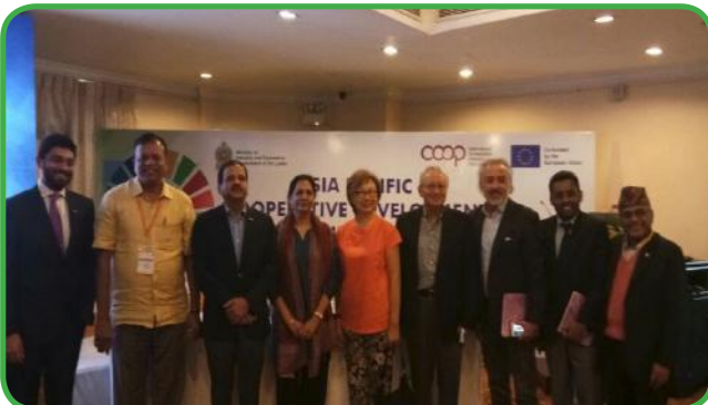
ಏಷಿಯಾ ಫೆಸಿಫಿಕ್ ತ್ರಿಲಂಕ ಕಾರ್ಯಕ್ರಮದಲ್ಲಿ ಸಂಯುಕ್ತ ಸಹಕಾರಿಯ ಪದಾಧಿಕಾರಿಗಳು