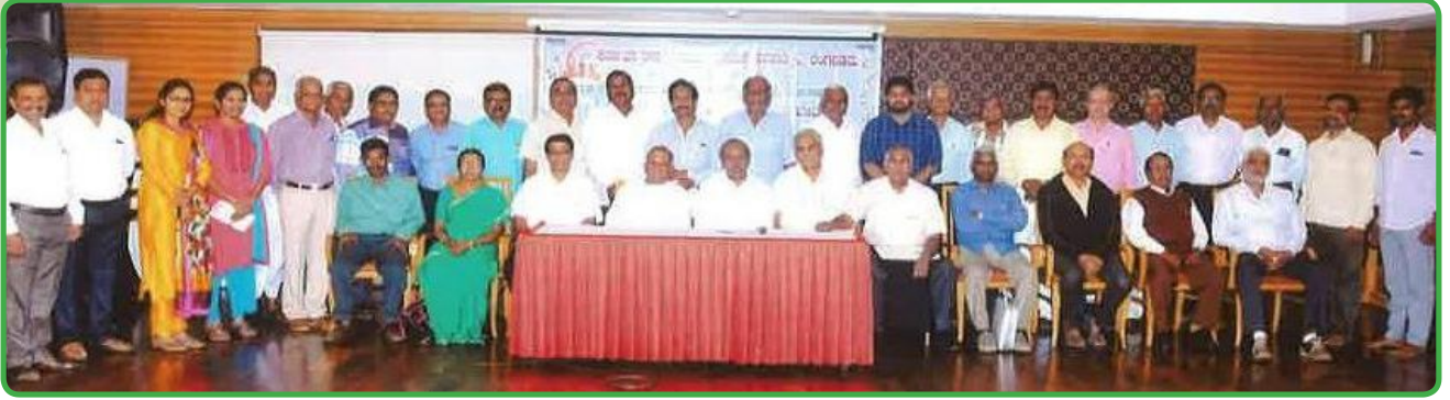
ಪಟ್ಟಣ ಸೌಹಾರ್ದ ಸಹಕಾರಿಗಳ ಪದಾಧಿಕಾರಿಗಳ ತರಬೇತಿಯಲ್ಲಿ ಭಾಗವಹಿಸಿದ ಪ್ರತಿನಿಧಿಗಳು

ರಿಯಲ್ಲಿ ಹಾಗೂ ಹೋಟೆಲ್ ಪಾರಿಜಾತ ಬೆಂಗಳೂರು ಇಲ್ಲಿ ಒಂದು ಚಿಂತನಾ ಸಭೆಯನ್ನು ಏರ್ಪಡಿಸಲಾಗಿತ್ತು. ಸಭೆಯಲ್ಲಿ ಹಿರಿಯ ಸಹಕಾರಿ ಧುರೀಣರು, ಸನ್ನದು ಲೆಕ್ಕ ಪರಿಶೋಧಕರು, ಸಂಯುಕ್ತ ಸಹಕಾರಿಯ ಅಧಿಕಾರಿಗಳು ಉಪಸ್ಥಿತರಿದ್ದರು. ಸದರಿ ಸಭೆಯಲ್ಲಿ ಬೆಂಗಳೂರು ನಗರದ 12 ಸೌಹಾರ್ದ ಸಹಕಾರಿಗಳಿಂದ 17 ಪ್ರತಿನಿಧಿಗಳು ಭಾಗವಹಿಸಿದ್ದರು.