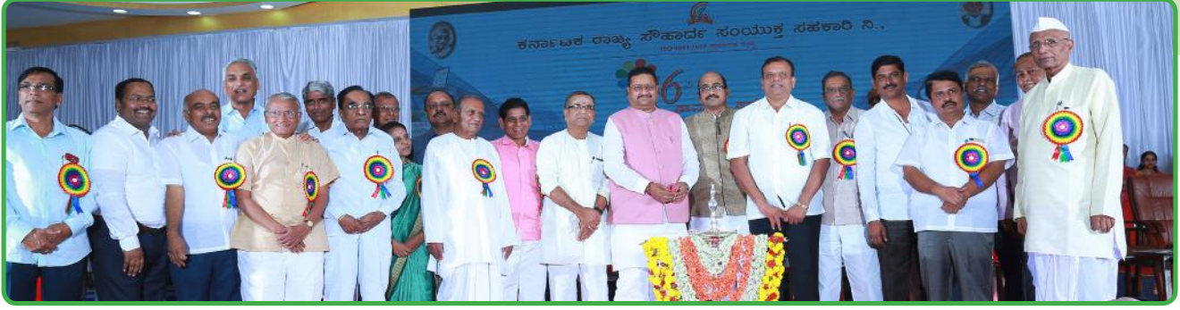
16ನೇ ವಾರ್ಷಿಕ ಸಾಮಾನ್ಯ ಸಭೆಯ ಉದ್ಘಾಟನೆ