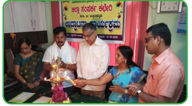
ಸಂಯುಕ್ತ ಸಹಕಾರಿಯ ಜಿಲ್ಲಾ ಸಂಪರ್ಕ ಕಛೇರಿಗಳ ಉದ್ಘಾಟನೆ