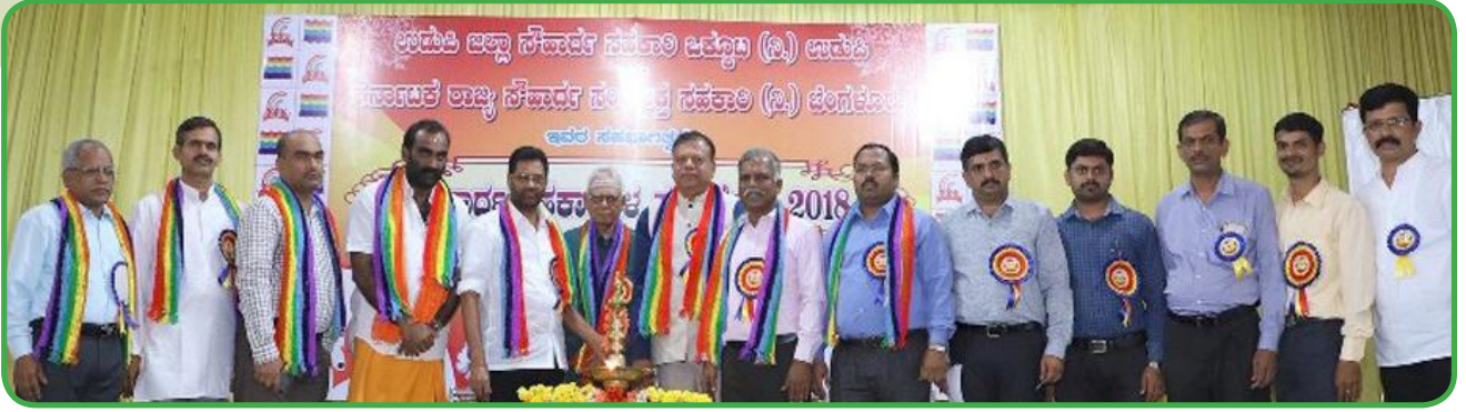
ಮೈಸೂರು ವಿಭಾಗದ ಸೌಹಾರ್ದ ಸಹಕಾರಿಗಳ ಸಮಾವೇಶ

ಸದಸ್ಯರ ದೂರುಗಳ ಹಿನ್ನೆಲೆಯಲ್ಲಿ ಸಹಕಾರಿಗಳ ಮಂಡಲಿ ಸಭೆಯಲ್ಲಿ ಸಂಯುಕ್ತ ಸಹಕಾರಿಯ ಪ್ರತಿನಿಧಿಗಳು ಭಾಗವಹಿಸಿ, ಮಂಡಲಿ ಸದಸ್ಯರಿಗೆ ಕಾಯ್ದೆಯ ಪ್ರಾವಧಾನಗಳನ್ನು ವಿವರಿಸಿ, ಕಾಯ್ದೆಯನುಸಾರ ಸುಲಲಿತವಾಗಿ ಸಹಕಾರಿಯನ್ನು ನಡೆಸಿಕೊಂಡು ಹೋಗುವಂತೆ ಸೂಚಿಸಲಾಗಿದೆ.