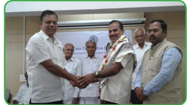
ಎನ್.ಸಿ.ಯು.ಐ ಅಧ್ಯಕ್ಷರಾದ ಶ್ರೀ ಚಂದ್ರಪಾಲ್ ಸಿಂಗ್ ಯಾದವ್‌ರವರ ಭೇಟಿ