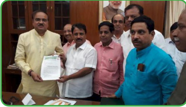
ಮಾನ್ಯ ಅನಂತಕುಮಾರ ಕೇಂದ್ರ ಸಚಿವರ ಬೇಟಿ ಹಾಗೂ ಮನವಿ ಸಲ್ಲಿಕೆ