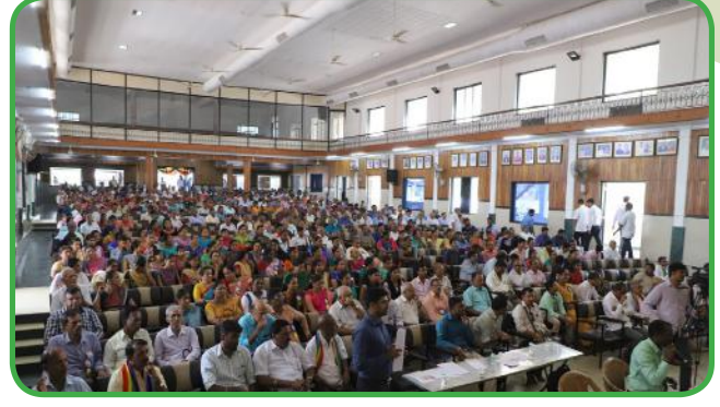
ಉಡುಪಿ ಜಿಲ್ಲೆಯಲ್ಲಿ ಸೌಹಾರ್ದ ಸಹಕಾರಿಗಳ ಸಮಾವೇಶ & ಸಮಾವೇಶದಲ್ಲಿ ಭಾಗವಹಿಸಿದ ಸಹಕಾರಿಗಳು

ಒಂದು ತರಬೇತಿಯನ್ನು ಬೆಂಗಳೂರಿನಲ್ಲಿ ಹಮ್ಮಿಕೊಳ್ಳಲಾಗಿತ್ತು. ಸದರಿ ತರಬೇತಿಯಲ್ಲಿ 5 ಪಟ್ಟಣ ಸೌಹಾರ್ದ ಸಹಕಾರಿ ಬ್ಯಾಂಕ್‌ಗಳಿಂದ 67 ಪ್ರತಿನಿಧಿಗಳು ಭಾಗವಹಿಸಿದ್ದರು.