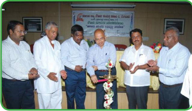
ಆಡಳಿತ ಪರಿಣತಿ ಅಭಿವೃದ್ಧಿ ತರಬೇತಿಯ ಉದ್ಘಾಟನೆ