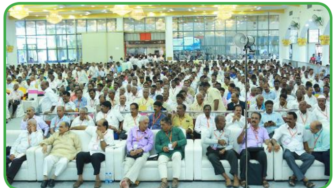
16ನೇ ವಾರ್ಷಿಕ ಸಾಮಾನ್ಯ ಸಭೆಯಲ್ಲಿ ಭಾಗವಹಿಸಿದ ಪ್ರತಿನಿಧಿಗಳು