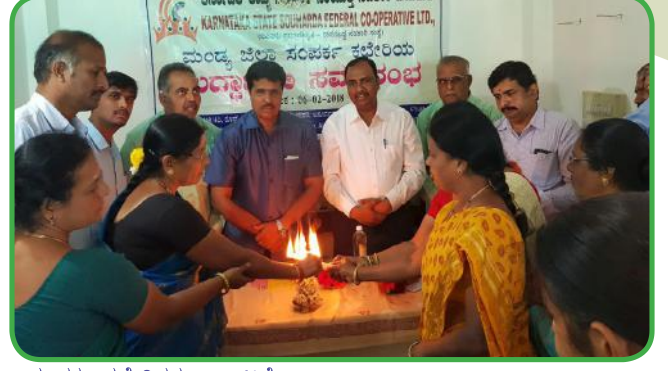
ಸಂಯುಕ್ತ ಸಹಕಾರಿಯ ಜಿಲ್ಲಾ ಸಂಪರ್ಕ ಕಛೇರಿಗಳ ಉದ್ಘಾಟನೆ

ರಿಗಳು ಹಾಗೂ 325 ಸೌಹಾರ್ದ ಸಹಕಾರಿಗಳು ಹಾಗೂ 1200 ಸಹಕಾರಿ ಪ್ರತಿನಿಧಿಗಳು ಭಾಗವಹಿಸಿದ್ದರು.