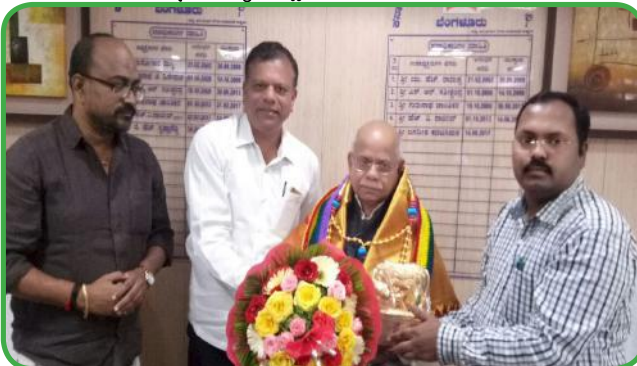
ಸಂಯುಕ್ತ ಸಹಕಾರಿಯ ಕಛೇರಿಗೆ ಕೇಂದ್ರ ಹಣಕಾಸು ರಾಜ್ಯ ಸಚಿವರಾದ ಶ್ರೀ ಶಿವಪ್ರತಾಪ ಶುಕ್ಲಾ ಭೇಟಿ