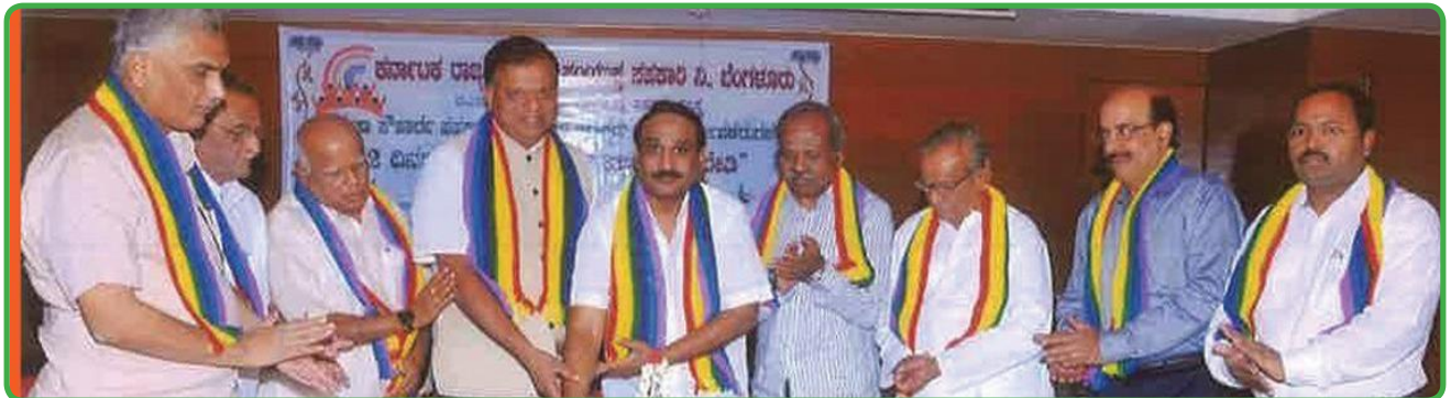
ಸೌಹಾರ್ದ ಸಹಕಾರಿ ಬ್ಯಾಂಕುಗಳ ಪದಾಧಿಕಾರಿಗಳು ಹಾಗೂ ನಿರ್ದೇಶಕರುಗಳಿಗಾಗಿ ಆಡಳಿತ ಪರಿಣತಿ ಅಭಿವೃದ್ಧಿ ತರಬೇತಿ