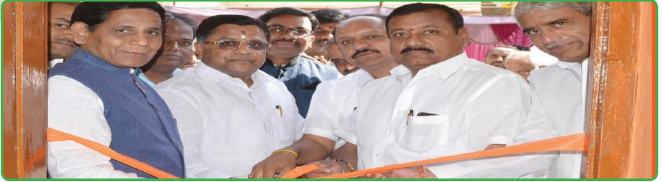
ಬೀದರ ಜಿಲ್ಲಾ ಸಂಪರ್ಕ ಕಛೇರಿಯ ಉದ್ಘಾಟನೆ

ತೊಂದರೆಗಳ ನಿವಾರಣೆಗೆ ಕ್ರಮವಿಡುವಂತೆ ಒತ್ತಾಯಿಸಿ ದಿನಾಂಕ ದಿನಾಂಕ 10 ಏಪ್ರಿಲ್ 2017ರಂದು ಸಂಯುಕ್ತ ಸಹಕಾರಿಯು ನಿಯೋಗವು ಮಾನ್ಯ ಸಂಸದೀಯ ವ್ಯವಹಾರಗಳ ಸಚಿವರಾದ ಶ್ರೀ ಅನಂತಕುಮಾರ್‌ರವರ ನೆರವಿನಿಂದ ಕೇಂದ್ರ ಹಣಕಾಸು ಸಚಿವರಾದ ಶ್ರೀ ಅರುಣ ಜೇಟ್ಟಿಯವರನ್ನು ಭೇಟಿ ಮಾಡಿ, ಮನವಿ ಸಲ್ಲಿಸಿತು ಹಾಗೂ ನಿಯೋಗದ ಸದಸ್ಯರು ಕರ್ನಾಟಕದ ಮಾನ್ಯ ಸಂಸದರಾದ ಶ್ರೀ ಪ್ರಹ್ಲಾದ ಜೋಶಿ, ಶ್ರೀ ಪ್ರತಾಪ ಸಿಂಹ, ಶ್ರೀ ಕೆ.ಹೆಚ್. ಮುನಿಯಪ್ಪ, ಶ್ರೀ ಸಂಗಣ್ಣ ಕರಡಿ ಮತ್ತು ಮಾನ್ಯ ಕೇಂದ್ರ ಸಾಂಖ್ಯಿಕ ಮತ್ತು ಕಾರ್ಯಕ್ರಮಗಳ ಅನುಷ್ಠಾನ ಸಚಿವರಾದ ಶ್ರೀ ಸದಾನಂದ ಗೌಡ, ಮುಂತಾದವರನ್ನೂ ಭೇಟಿ ಮಾಡಿ, ವಿಷಯ ತಿಳಿಸಿ, ಅವರ ಸಹಕಾರ ಕೋರಿದರು.