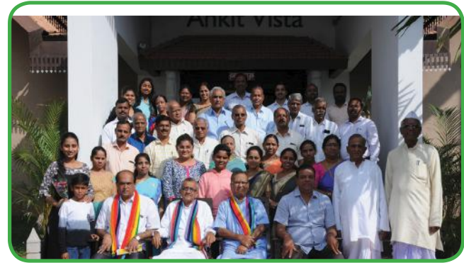
ಸಂಯುಕ್ತ ಸಹಕಾರಿಯ ಆಡಳಿತ ಮಂಡಳಿ ತರಬೇತಿಯಲ್ಲಿ ಭಾಗವಹಿಸಿದ ನಿರ್ದೇಶಕರುಗಳು