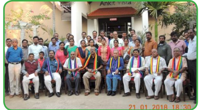
ಪಟ್ಟಣ ಸಹಕಾರ ಬ್ಯಾಂಕ್‌ಗಳ ಮುಖ್ಯಕಾರ್ಯನಿರ್ವಾಹಕರುಗಳ ತರಬೇತಿಯಲ್ಲಿ ಸಹಕಾರಿ ಧರೀಣರು ಹಾಗೂ ಭಾಗವಹಿಸಿದ ಪ್ರತಿನಿಧಿಗಳು