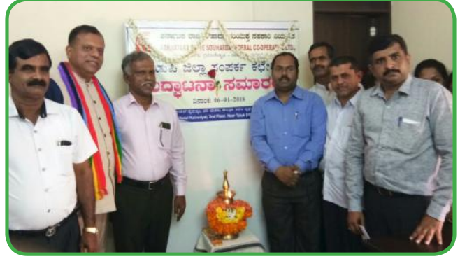
ಸಂಯುಕ್ತ ಸಹಕಾರಿಯ ಜಿಲ್ಲಾ ಸಂಪರ್ಕ ಕಛೇರಿಗಳ ಉದ್ಘಾಟನೆ