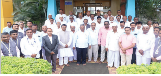
ಹುಲ್ಲೋಳಿ : ಅರಿಹಂತ ಅರ್ಬನ್ ಸೌಹಾರ್ದ ಕ್ರೆಡಿಟ್ ಸಹಕಾರಿ ಲಿ.,