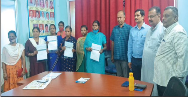
ಶಿವಮೊಗ್ಗ : ದಿನಾಂಕ 10-11-2021 ರಂದು ಹೊಯ್ಸಳ ಕರ್ನಾಟಕ ಪತ್ತಿನ ಸೌಹಾರ್ದ ಸಹಕಾರಿ ನಿ., ಶಿವಮೊಗ್ಗ ಈ ಸಹಕಾರಿಯಿಂದ ಶ್ರೀ ಶಕ್ತಿ